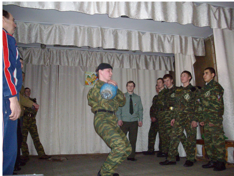
Раз-два, раз-два, будет 32!