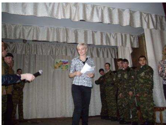
Не грусти, солдат! (подарок от гр.35-36)