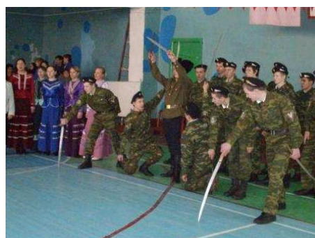
Выступление театрально- вокальной студии «Хуторок»